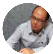
主編 聽感 韓享良

Diamond 220的效率86dB，並不算特別高，加上建議功率可達100W，建議銀給它較大功率能有較好發揮，聲音會比較寬鬆。它的高音導波器深度頗深，已經有一點接近號角喇叭的特性，所以擺位要多留意，有時Ton-in角度差一點點效果就有很大差別。然而只要搭配得宜，它能呈現出很有魅力的聲音，尤其搭配英國系擴大機往往能有加分效果，例如NAD、Cambridge推力充實者都是不錯的選擇。在適當搭配之下，220的高頻明亮有力，但不過量，中頻則是能呈現所謂的「大中音」傾向，人聲形體較大、略為前傾，同時寬鬆，然而聲音仍然是綿密的，並不散形，用它聆聽爵士或人聲都很迷人，例如Anne Bisson的Blue Mind，女聲顯得溫柔又溫暖，但仍然蘊含力量，聽來撫慰人心。聆聽小野麗莎的Bossa Nova也很不錯，人聲濃郁，富感染力，伴奏也有動感，但整體不失輕鬆，以其價位而論，表現算得上相當有水準了。