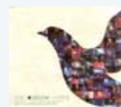
播這個好聽 張學友 活出生命Live演唱會

另外，如果能搭配驅動力強勁的擴大機，Diamond 220能呈現的能量會超過你的預期，而且在這樣的狀況下能營造出一個廣大開闊的舞台，音場規模也超出預期。中頻段表現也很傑出，細節非常豐富，和多數萬元出頭喇叭相比，它的人聲聽起來就是比較有表情變化，以其價位來說實在是不簡單。