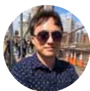
| 編輯 聽感 | 黃有場

Diamond 220給人一種爽朗的感覺，音像的輪廓清晰，線條收斂明確，一點也沒有黏膩的感覺。當音像的輪廓線條不清楚時，會有一種「好像有聚焦，卻不是很浮凸」的聽感，這種若有似無的模糊感就會讓人有聲音很黏、很膩的聯想，自然不會想繼續聽下去。顯然Diamond 220不屬於這種類型，它對於細節的表現很明確，播放鋼琴演奏的時候琴音顆粒分明，播放吉他的時候撥弦又具備極佳的彈性，表示Diamond 220再生這些樂器聲音的細節時，不僅不會草草帶過，而是讓你聽見完整的演出過程。