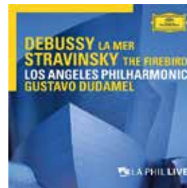
Debussy – La Mer, Stravinsky – The Firebird – Dudamel / LA Philharmonic 音樂檔