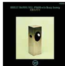
Shelly Manne / Bill Evans with Monty Budwig – Empathy 音樂檔